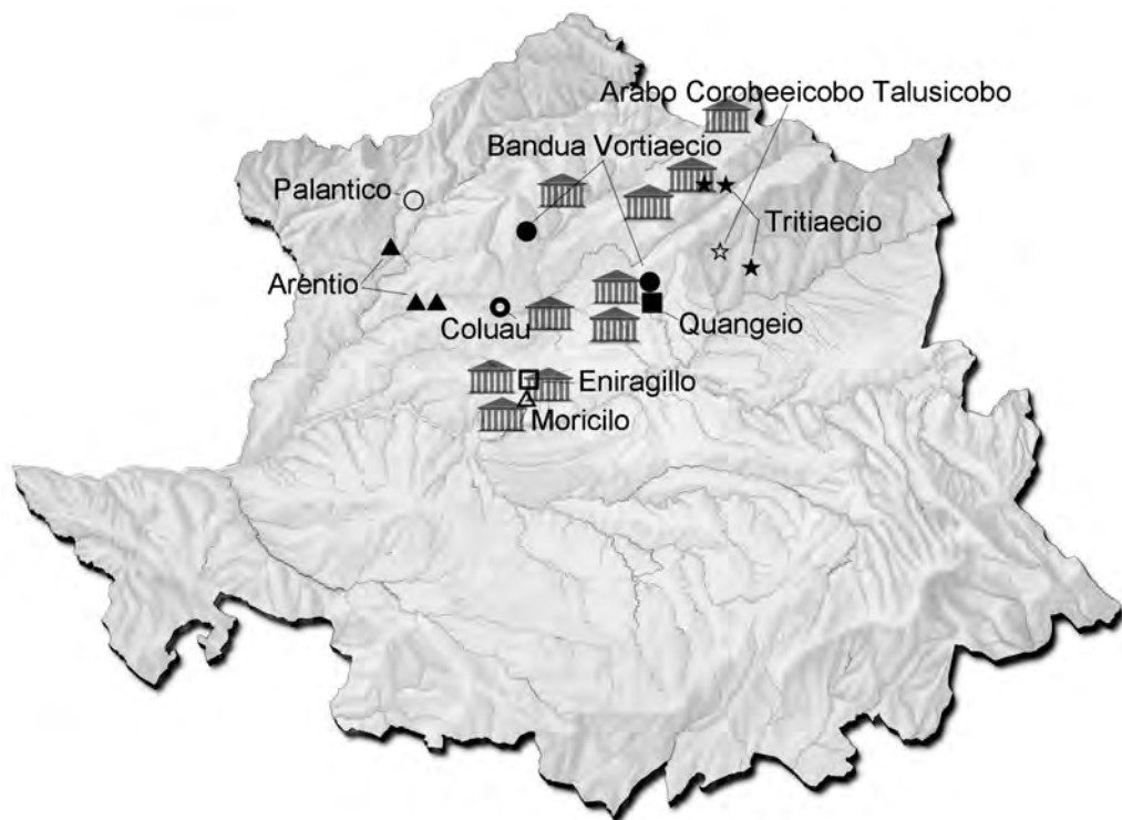
FIGURA 4 TEÓNIMOS Y EPÍTETOS

Por tanto habría que pensar en Arentius como un dios de carácter salutífero vinculado a la salud. Olivares lo considera como un dios relacionado con el ámbito privado y lo asocia a divinidades de carácter terapéutico comparables al Mercurio y al Apolo indígenas 88 . Los testimonios de su culto se concentran en un área comprendida en el triángulo Guarda–Castelo Branco–Coria, entre los afluentes del Tajo, Zêzere y Alagón.