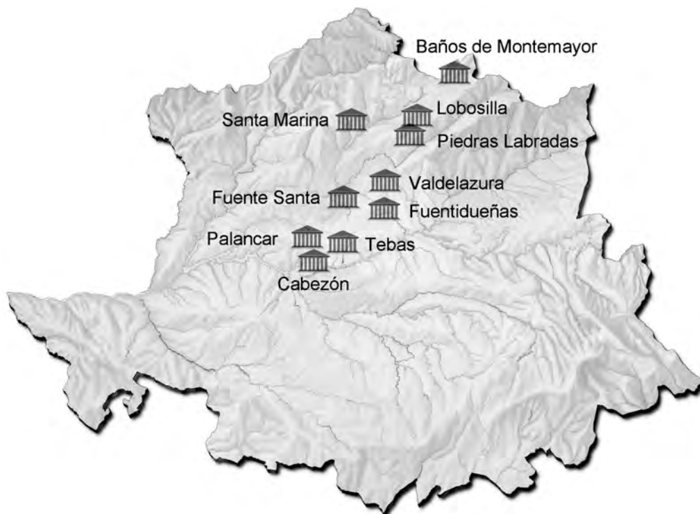
FIGURA 2 SANTUARIOS

De igual manera, al norte del territorio de nuestra zona de estudio, en Baños de Montemayor, es evidente la existencia de un antiguo santuario a divinidades relacionadas con las aguas salútferas como indica la extraordinariamente abundante epigrafía dedicada a las Ninphae del lugar 35 . Y no es el único, pues pueden citarse otros lugares de culto relacionados con las aguas 36 . En la finca “Alturas de Abajo” existe un edificio de planta poligonal donde se ubicaba el antiguo balneario de Valdelazura y en cuyos alrededores se han descubierto aras votivas –una de ellas dedicada a Salus –, basas de columnas, sillares labrados y monedas romanas 37 .